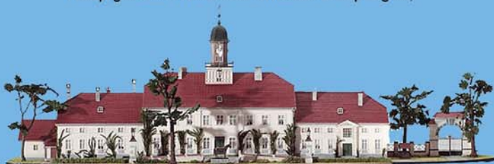
Modell des Landstallmeisterhauses